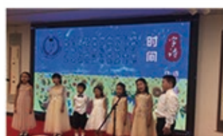
开幕式以日本琴童乐团的小乐手悠扬轻快的中外名曲拉开帷幕。

本次邀请展展品共一百一十件, 及展播儿童诵唱《字诗》节目。目前《字诗》已在全球四十多个国家传播。